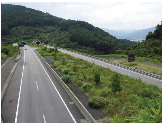
紺東・柿本地区の全景