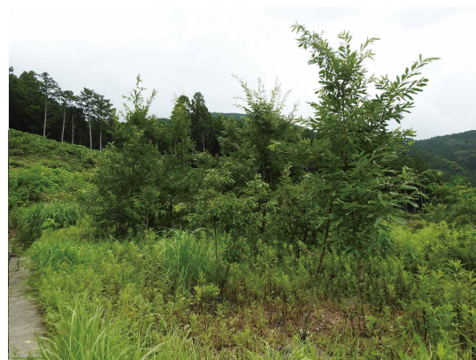
伐採跡地に自然の植生が回復しつつある法面のようす