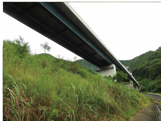
地域性苗木が植栽された区画