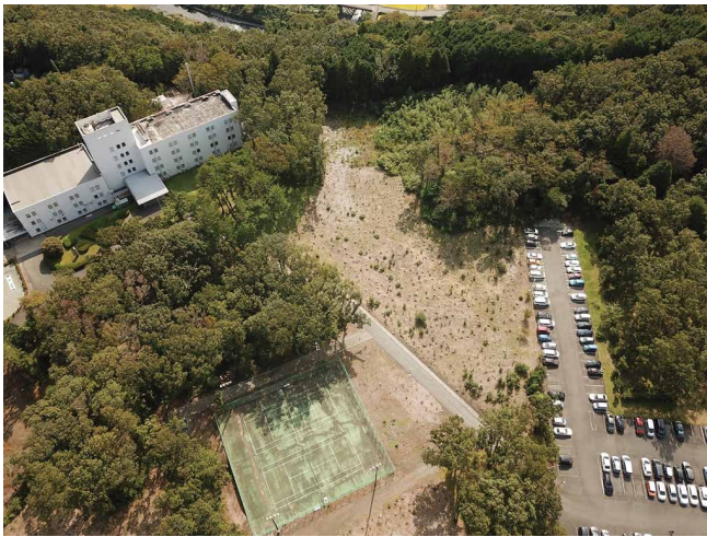
上空から見た「日立ハイテクサイエンスの森」