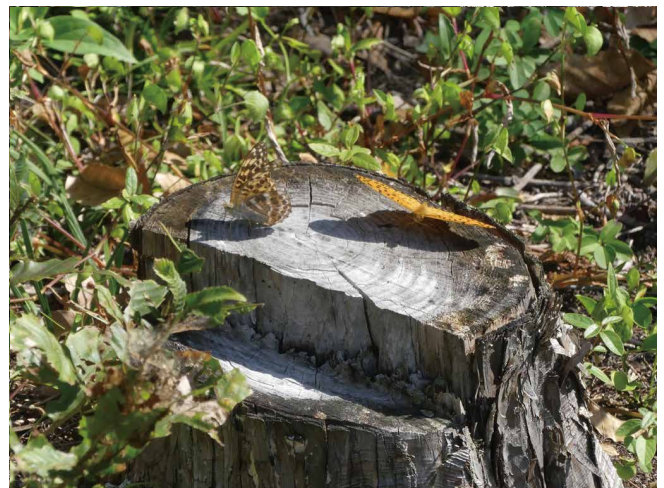
森で確認されたミドリヒョウモン(タテハチョウ科)