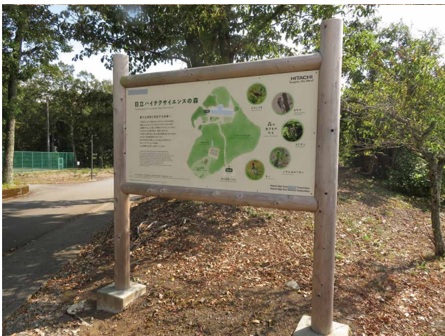
敷地内に設置された取り組みを紹介する看板