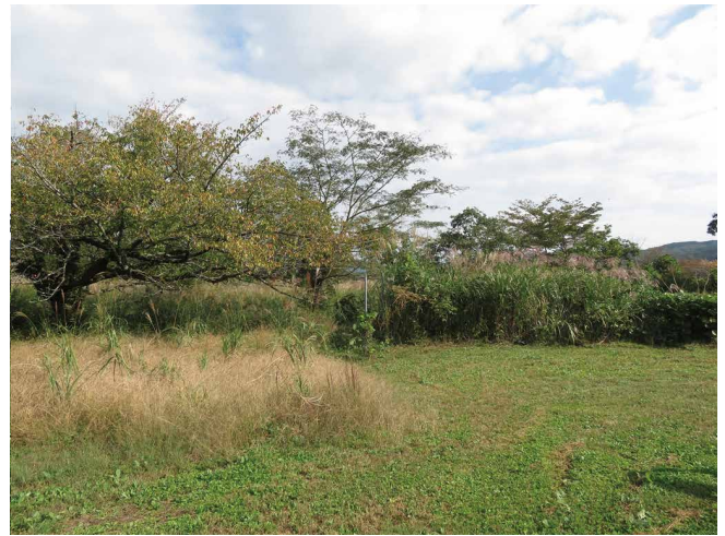
多様な在来の野草の広がる半自然草地