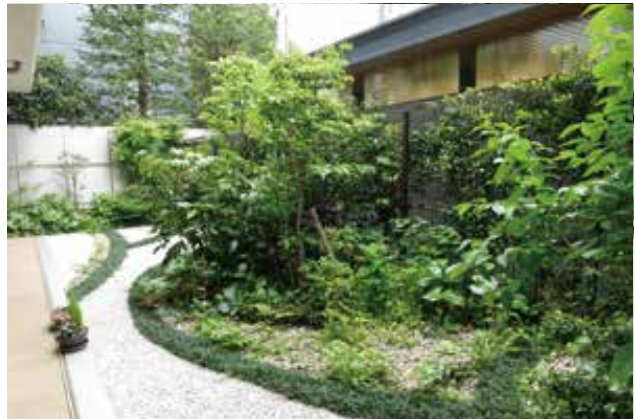
四季の潤いを感じさせる在来植物による植栽