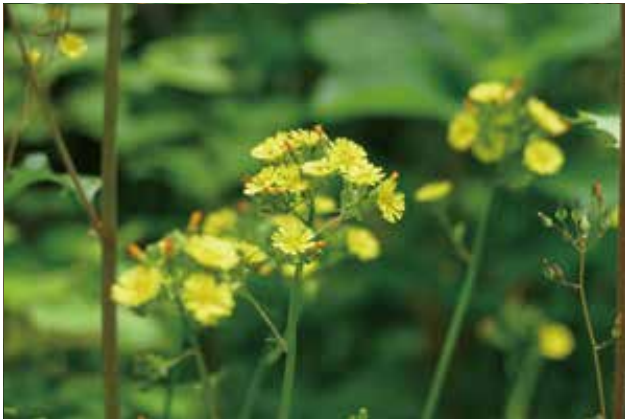
地域本来の植物が開花する様子