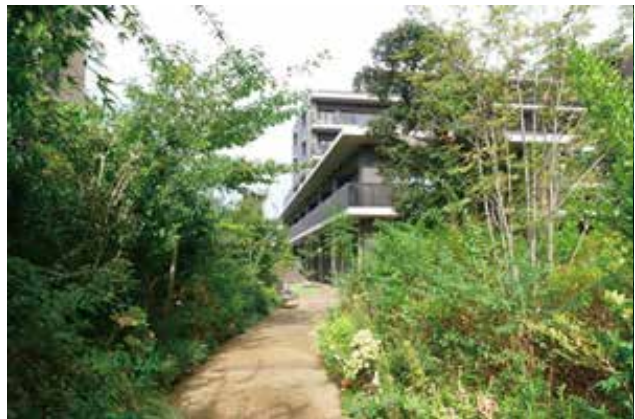
在来種を多く配置した散策路