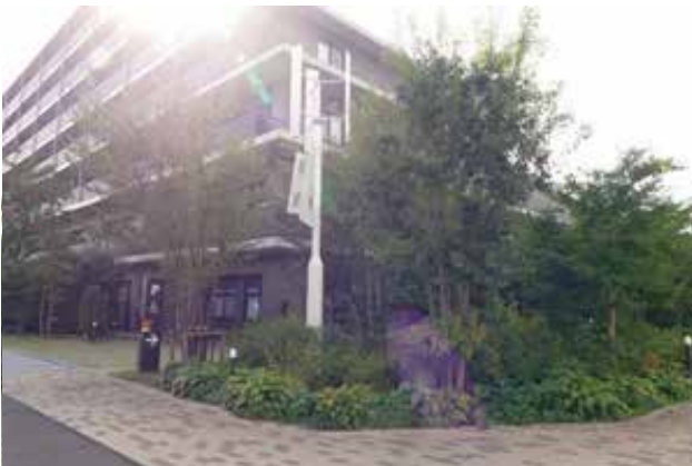
アリスタージュ経堂の外観