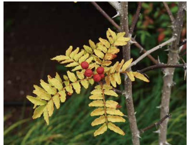
サンショウの黄葉と実