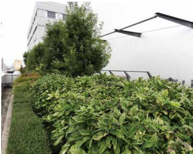
藪をイメージした植栽