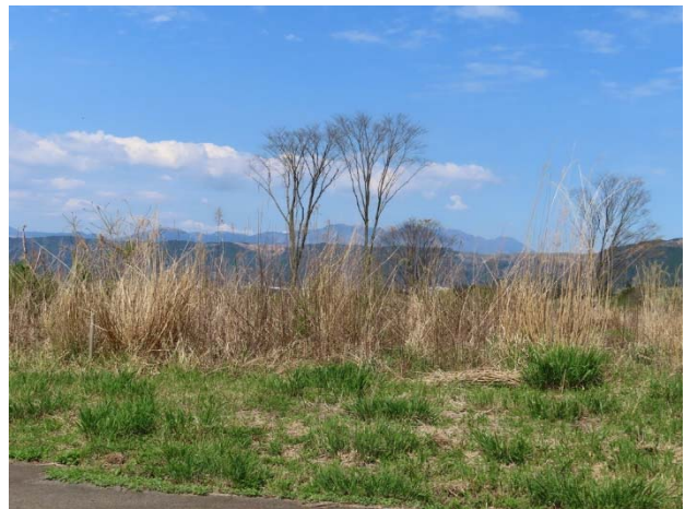
スギ人工林から整備された草地