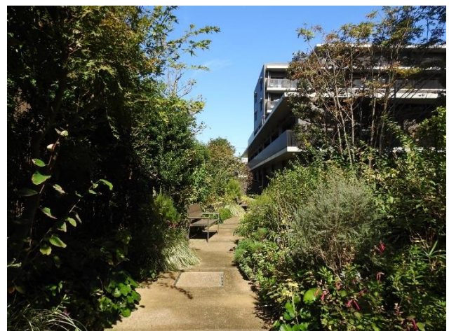
在来種が多く配置された中庭の散策路