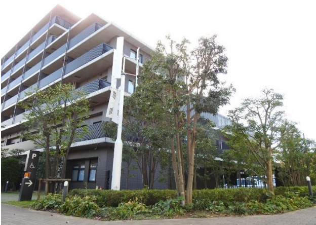
アリスタージュ経堂の外観