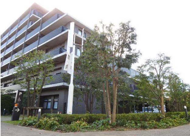
アリスタージュ経堂の外観