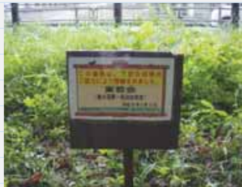
選定地の管理を担っています