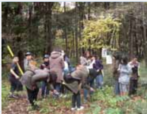
地域の小学生やその保護者を招き、選定地の植物や昆虫の勉強会を行っています

また、多くの市民に「木もれびの森」への関心を高め、森の保全や活動ボランティア、次世代に引き継ぐために森に触れ、感じてもらうきっかけづくりとして、近隣の小学校の環境学習において子どもたちによる森周辺のゴミ拾いや木の実工作などを実施しています。