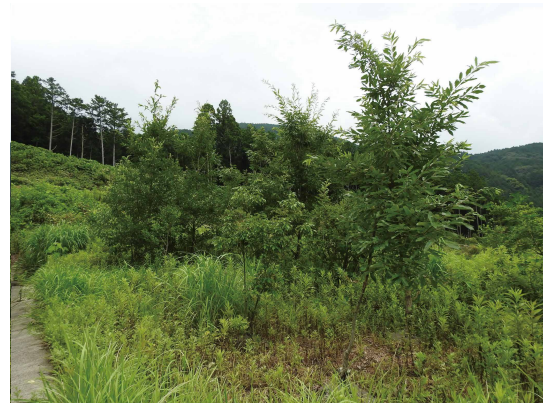
トンネル坑口上部の植栽