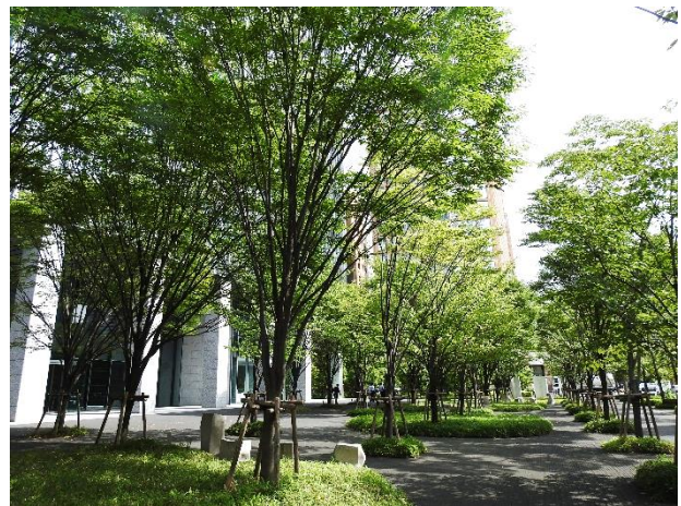
緑豊かな「都市の森」