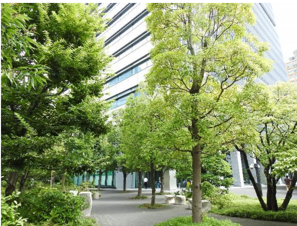
大崎フォレストビルディングの外観