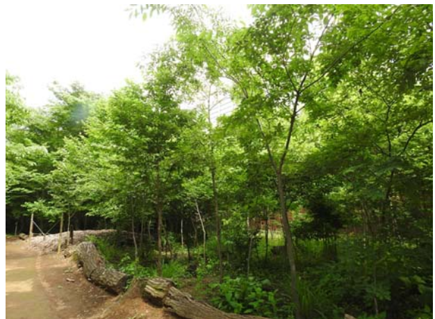
5年前に伐採管理した区画