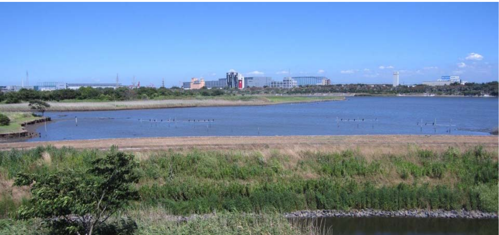
千葉県行徳鳥獣保護区(市川野鳥の楽園)